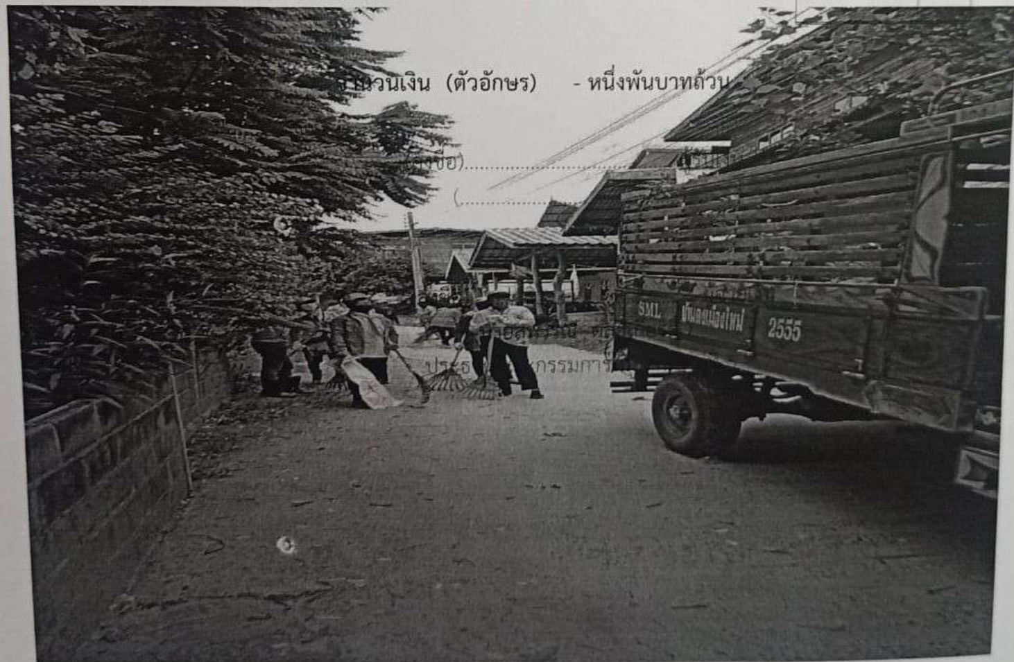
รวมเงิน (ตัวอักษร) - หนึ่งพันบาทถ้วน