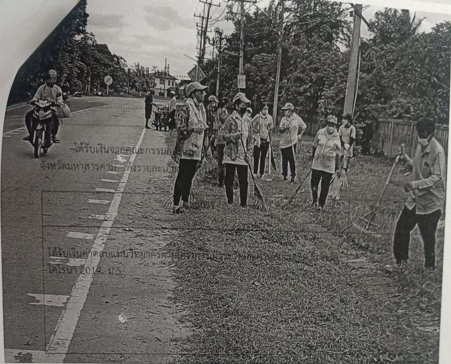
-ได้รับเงินจวคคณกรรมการหมู่บ้าน จังหวัดมหาสารคาม ตั้งรายละเดือน