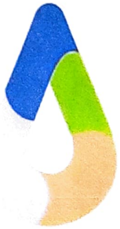
สัญลักษณ์รูปหยดน้ำ

อถล. เป็นการรวมกลุ่มของประชาชนในท้องถิ่นที่มีจิตอาสาในการช่วยเหลืองานขององค์กรปกครองส่วนท้องถิ่น เกี่ยวกับการจัดการสิ่งปฏิกูลและมูลฝอย การปกป้องและรักษาทรัพยากรธรรมชาติและสิ่งแวดล้อม